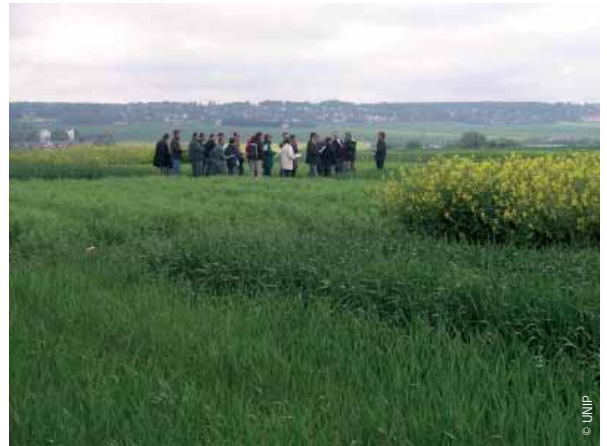
La marge azotée maximale du colza est supérieure avec un précédent pois par rapport à un précédent céréale à paille.

La succession pois-colza trouve un avantage indéniable dans la gestion du cycle de l'azote : après le pois, qui laisse des reliquats azotés élevés, le colza semé plus tôt qu'un blé présente une excellente capacité d'absorption de cet élément nutritif.