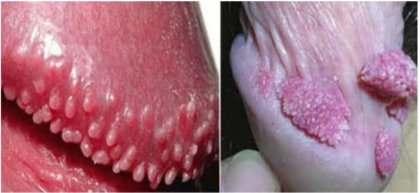
Gai sinh dục

liệu có thêm cả gai nhú, có hình mẫu tương tự hoa súp lơ hoặc mào gà.