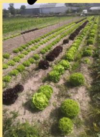
Travail en buttes pour permettre le passage de l'animal

La traction animale peut se faire aussi bien pour le travail du sol que pour le désherbage mécanique. L'âne ou le cheval peuvent être utilisés.