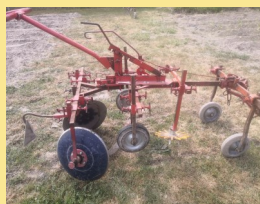
Kassine pour le désherbage mécanique