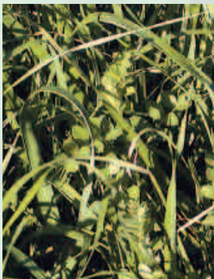
Les mélanges de Graminées et Légumineuses (ici RGI + vesce) sont intéressants à introduire dans les rotations de légumineuses

L'engrais vert est l'occasion d'introduire des espèces différentes de celles couramment cultivées sur l'exploitation, pour