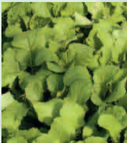
Les Crucifères, en se développant rapidement, assurent une protection efficace de la surface du sol

• Après destruction de l'engrais vert , l'incorporation d'une grande quantité de biomasse fraîche stimule l'activité biologique. Les vers de terre, qui se nourrissent des débris végétaux, prolifèrent. En creusant des galeries, ils augmentent la porosité du sol et facilitent ainsi le resuyage et l'aération.