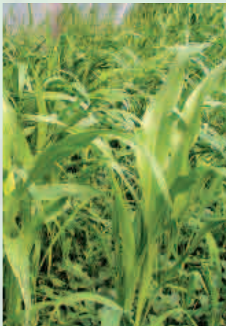
Le sorgho fourrager est l'engrais vert de référence sous abri l'été

Elle est déterminante pour la réussite d'un engrais vert. Ainsi pour un engrais vert d'automne, on sèmera les Légumineuses,