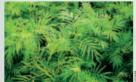
Les tagetes minuta ont des propriétés nématocides vis-à-vis de Meloidogyne